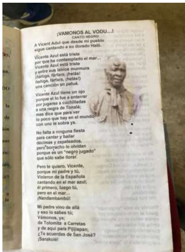
Folleto perteneciente a Celín donde aparece el fragmento de "Vámonos al Vodú" del poeta Duvalier.