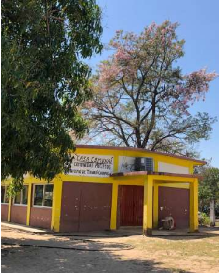
Casa comunal ubicada en el Mancomún de mulatos.