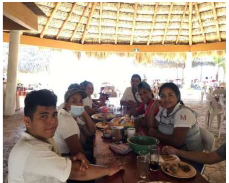
Integrantes e hijos de los integrantes de la cooperativa “El madre sal” durante su hora de descanso.