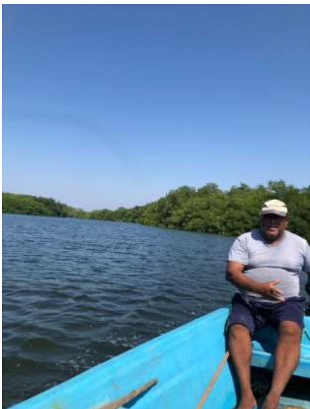
Pescador entrevistado en la comunidad "La barra" también es miembro de la cooperativa turística.

Fotografías tomadas en las comunidades visitadas durante las entrevistas.