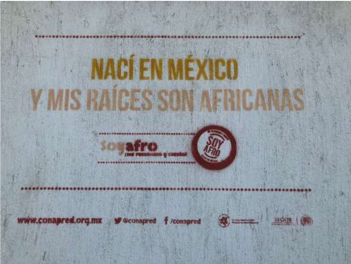
En la pared de una vieja casa en las calles de Tonalá Chiapas.