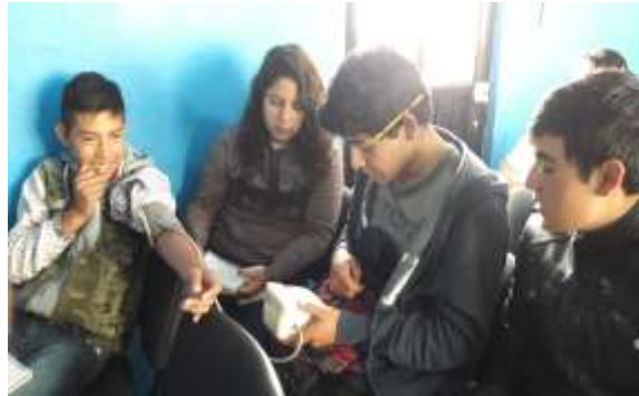
Al fondo, guías turísticos del Santuario de la Luciérnaga ESRT en sesión formativa. [Fotografía de Alexis Aguilar]. (Comisaría Ejidal. 2017). Multimedia del PEAS. Ejido Santa Rita Tlahuapan, Pue.