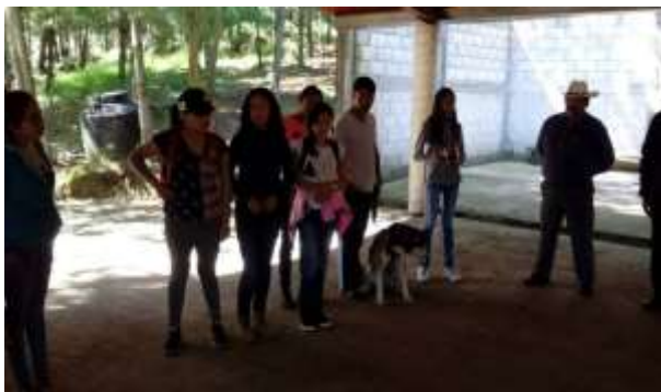
Al fondo la comunidad universitaria y comunidad ejidal en práctica de entrevista. (Manantial Atlamayalco. 2017). Multimedia del PEAS. Ejido Santa Rita Tlahuapan, Pue.

La siguiente tabla resume las técnicas e instrumentos que se diseñaron y aplicaron en cada acción educativa del PEAS: