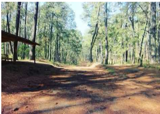
Fotografía 2: Ahuacuahutla

Sendero Principal del Santuario de la Luciérnaga ESRT. [Fotografía de Sonia Hernández]. (Santa Rita Tlahuapan. 2018). Somos Naturaleza. Ejido Santa Rita Tlahuapan, Pue.