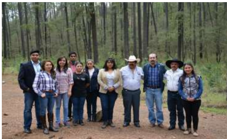
Fotografía 7: Visita de campo

Al fondo, integrantes de la comunidad ejidal y comunidad universitaria. (Santuario de la Luciérnaga. 2017). Multimedia del PEAS. Ejido Santa Rita Tlahuapan, Pue.