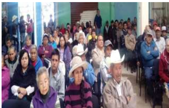
Al fondo comunidad ejidal. (Comisaría Ejidal. 2017). Multimedia del PEAS. Ejido Santa Rita Tlahuapan, Pue.