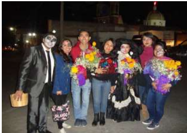
Fotografía 22: Catrinas y Catrines del desfile.

Al fondo la comunidad universitaria en el desfile de catrinas y catrines. [Fotografía de Alexis Aguilar]. (Parroquia de Santa Rita de Casia. 2017). Multimedia del PEAS. Santa Rita Tlahuapan, Pue.