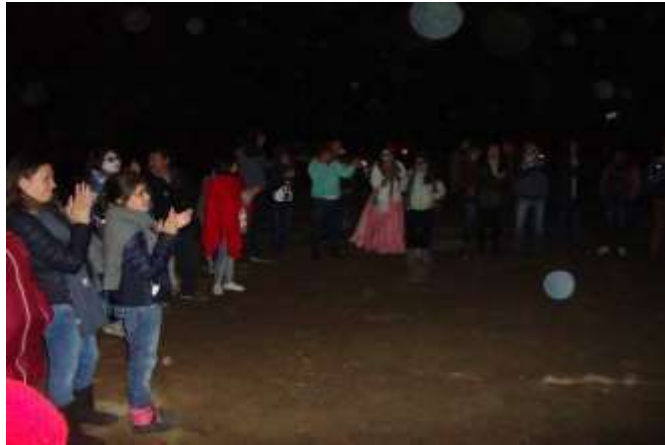
Fotografía 20: Recorrido Entre Leyendas.

Al fondo turismo asistente al recorrido. (Santuario de la Luciérnaga. 2017). Multimedia del PEAS. Santa Rita Tlahuapan, Pue.