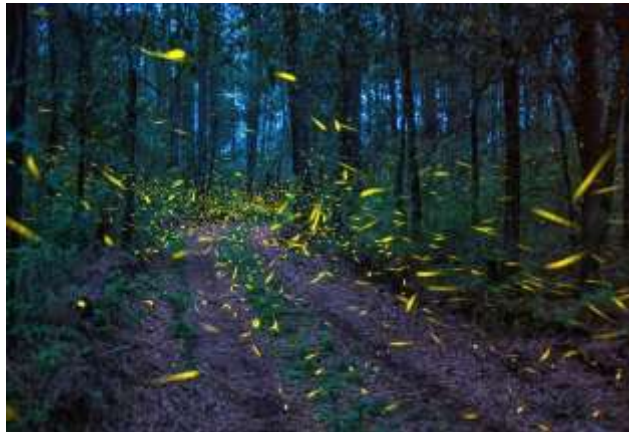
Figura 1: Santuario de la Luciérnaga

Avistamiento de luciérnagas durante los meses de junio, julio y agosto. [Fotografía de Pedro Berruecos]. (Santa Rita Tlahuapan. 2019). “...sólo una mariposa basta para apagarte. Calla... ¡Pero es posible! ¡Aquella luciérnaga es la luna! Ejido Santa Rita Tlahuapan, Pue.