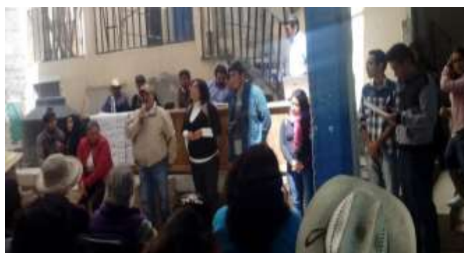
Al frente miembros de la comunidad ejidal y universitaria. Exposición de proyectos. (Comisaría Ejidal. 2017). Multimedia del PEAS. Ejido Santa Rita Tlahuapan, Pue.