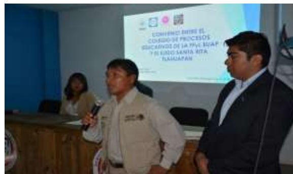
Al fondo, guías turísticos del Santuario de la Luciérnaga, Ejidatarios, pobladores e integrantes de la comunidad universitaria. (Comisaría Ejidal. 2017). Multimedia del PEAS. Santa Rita Tlahuapan, Pue.