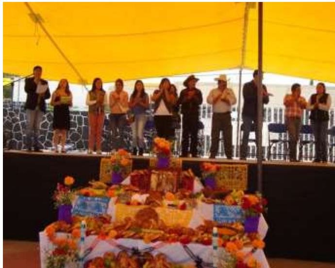
Al fondo integrantes de la comunidad ejidal y universitaria. (Cabecera municipal. 2017). Multimedia del PEAS. Santa Rita Tlahuapan, Pue.