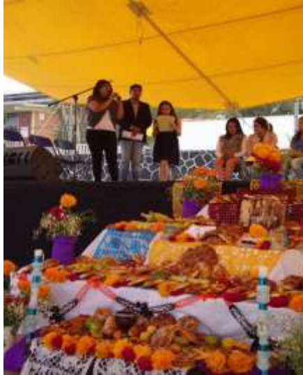
Fotografía 15: Inauguración del Primer Festival de la Muerte.

Al fondo integrantes de la comunidad ejidal y universitaria. [Fotografía de Alexis Aguilar]. (Cabecera municipal. 2017). Multimedia del PEAS. Santa Rita Tlahuapan, Pue.