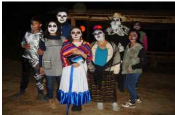
Fotografía 19: Recorrido Entre Leyendas.

Al finalizar el recorrido se llevó a cabo una reflexión entre todos los asistentes para valorar las costumbres y su relación que guarda con el medio ambiente. Del turismo que presencié el recorrido, provenía de estados como Veracruz, Tlaxcala, Estado de México, Puebla y Oaxaca. Asimismo, pobladores de la región presenciaron el recorrido al igual que docentes de la Licenciatura en Procesos Educativos de la BUAP.