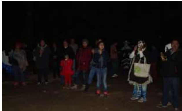
Fotografía 21: Recorrido Entre Leyendas.

Al fondo turismo asistente al recorrido. [Fotografía de Alexis Aguilar]. (Santuario de la Luciérnaga. 2017). Multimedia del PEAS. Santa Rita Tlahuapan, Pue.