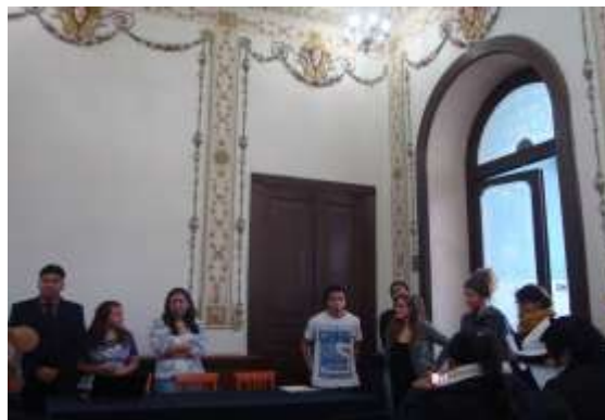
Fotografía 11: Presentación de acciones educativas ante la comunidad ejidal.

Al fondo integrantes de la comunidad universitaria exponiendo ante los ejidatarios las acciones futuras a implementar. (Sala Severo Martínez, FFyL BUAP. 2017). Multimedia del PEAS. Ejido Santa Rita Tlahuapan, Pue.