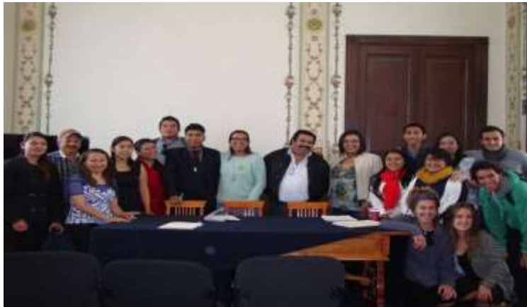
Al fondo integrantes de la comunidad ejidal y universitaria. (Sala Severo Martínez, FFYL BUAP. 2017). Multimedia del PEAS. Ejido Santa Rita Tlahuapan, Pue.

Dicho lo anterior, los ejidatarios aprobaron el diseño, implementación y financiamiento de dos acciones educativas; la primera de ella, titulada, Primer Festival de la Muerte ; actividad cultural que buscó la promoción de usos, costumbres y tradiciones de Santa Rita Tlahuapan; específicamente sobre el día de muertos. La segunda acción educativa fue la constitución de una Feria Navideña que permitiera a los pobladores, establecer una economía solidaria a