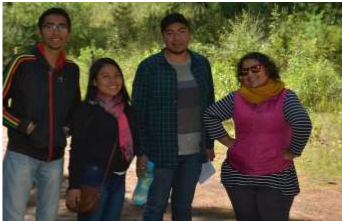
Fotografía 24: Visita de Campo al Santuario de la Luciérnaga.

Al fondo la comunidad universitaria en vista de campo. (Santuario de la Luciérnaga. 2017). Multimedia del PEAS. Ejido Santa Rita Tlahuapan, Pue.