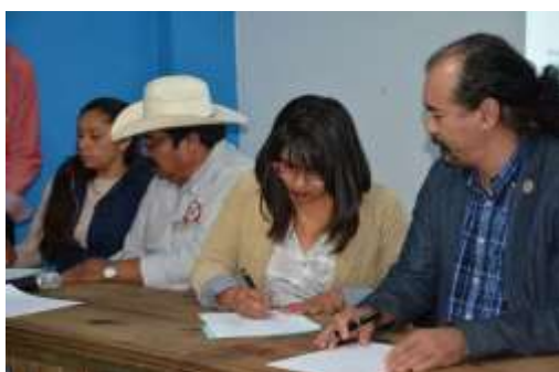
Fotografía 3: Firma del convenio de colaboración.