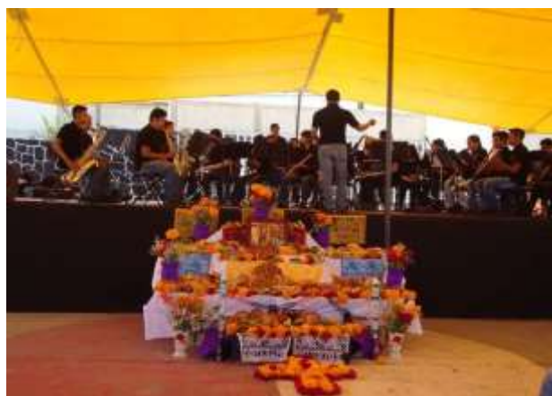
Fotografía 17. Presentación de bandas sinfónicas.

Al fondo la Orquesta Sinfónica de Huejotzingo. [Fotografía de Alexis Aguilar]. (Cabecera municipal. 2017). Multimedia del PEAS. Santa Rita Tlahuapan, Pue.